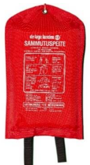
Kuva 7: Sammutuspeite

Sammutuspeite sopii pienten palonalkujen ja ihmisten päällä olevien vaatteiden sammuttamiseen tukahduttamalla. Suositeltava koko on vähintään 180 x 120 cm.