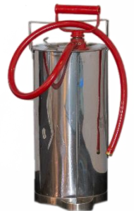
Kuva 6: Sankoruisku

F-luokan sammuttimet on suunniteltu estämään rasvan uudelleen syttyminen. Sammutusvaikutus perustuu palokaasujen eristämiseen sekä tukahduttamiseen. F-luokan sammuttimella on aina myös A- ja/tai B-luokitus. Mikäli F-luokan sammutin on ammattikeittiön ainoa sammutin, on huomioitava riittävä teholuokka myös A- ja/tai B-luokituksessa. Elintarvikepalosammuttimet sopivat keittiötiloihin.