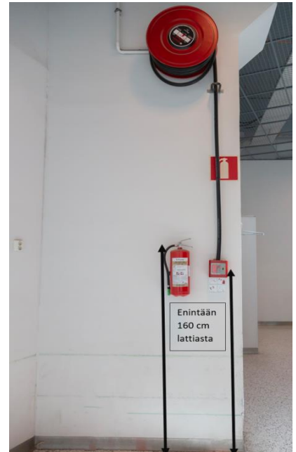
Kuva 9: Sammuttimen kahvan ja pikapalopostin letkun pään sijoitus lattiapinnasta

Myös pikapalopostin sijoituskorkeudessa on huomioitava, että letkun saa helposti lattiatasosta käyttöön. Pikapalopostikaappi sijoitetaan siten, että kaapin alareuna on enintään 120 cm korkeudella lattiapinnasta. Ylemmäs sijoitettavan pikapalopostikelan alas laskeutuvan letkun pää tulee sijoittaa enintään 160 cm korkeudelle lattiapinnasta.