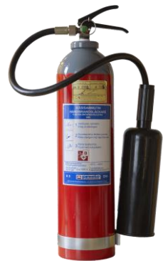
Kuva 5: Hiilidioksidisammutin

Hiilidioksidin sammutusvaikutus perustuu sekä tukahduttamiseen että jäähdyttämiseen. Hiilidioksidisammutin sopii huonosti käytettäväksi ulkoilmassa. Hiilidioksidisammuttimella on turvallista sammuttaa jännitteisiäkin kohteita ja siksi se sopii hyvin mm. atk-, tele- ja sähkötiloihin.