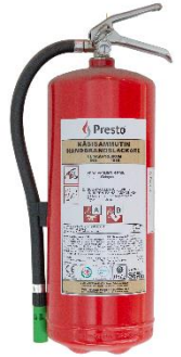
Kuva 4: Nestesammutin

Nestesammuttimen etuna on jauhesammutinta kevyempi jälkisiivous. Nestesammuttimen pakkasenkestävyys ja sähköturvallisuus tulee tarkastaa sammuttimen käyttöohjeesta. Nestesammutin ei sovellu ainoaksi sammuttimeksi tiloihin, joissa varastoidaan tai käsitellään palavia kaasuja.