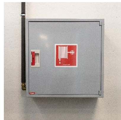
Kuva 2: Pikapaloposti

Pikapalopostit kuuluvat sekä rakennukseen kiinteästi asennettaviin sammutuslaitteisiin että alkusammutuskalustoon. Veden sammutusvaikutus on pääasiassa jäähdyttävä, mutta vesihöyry myös tukahduttaa paloa tehokkaasti. Vesi ei sovellu rasvapaloihin tai palavien nesteiden sammuttamiseen. Vesi myös johtaa sähköä, joten jännitteelliset kohteet on tehtävä virrattomiksi ennen vedellä sammuttamista.