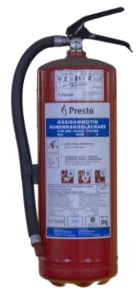
Kuva 3: Jauhesammutin

Jauhesammutin on hyvä yleissammutin lähes kaikkiin paloihin. Huonona puolena voidaan pitää sammutusaineen liikaavuutta; hienojakoinen pöly voi aiheuttaa esim. sähkölaitteille suurta vahinkoa. Likaavuuden vuoksi jauhesammutinta ei suositella tiloihin, joihin voi kohdistua ilkkivaltaa.